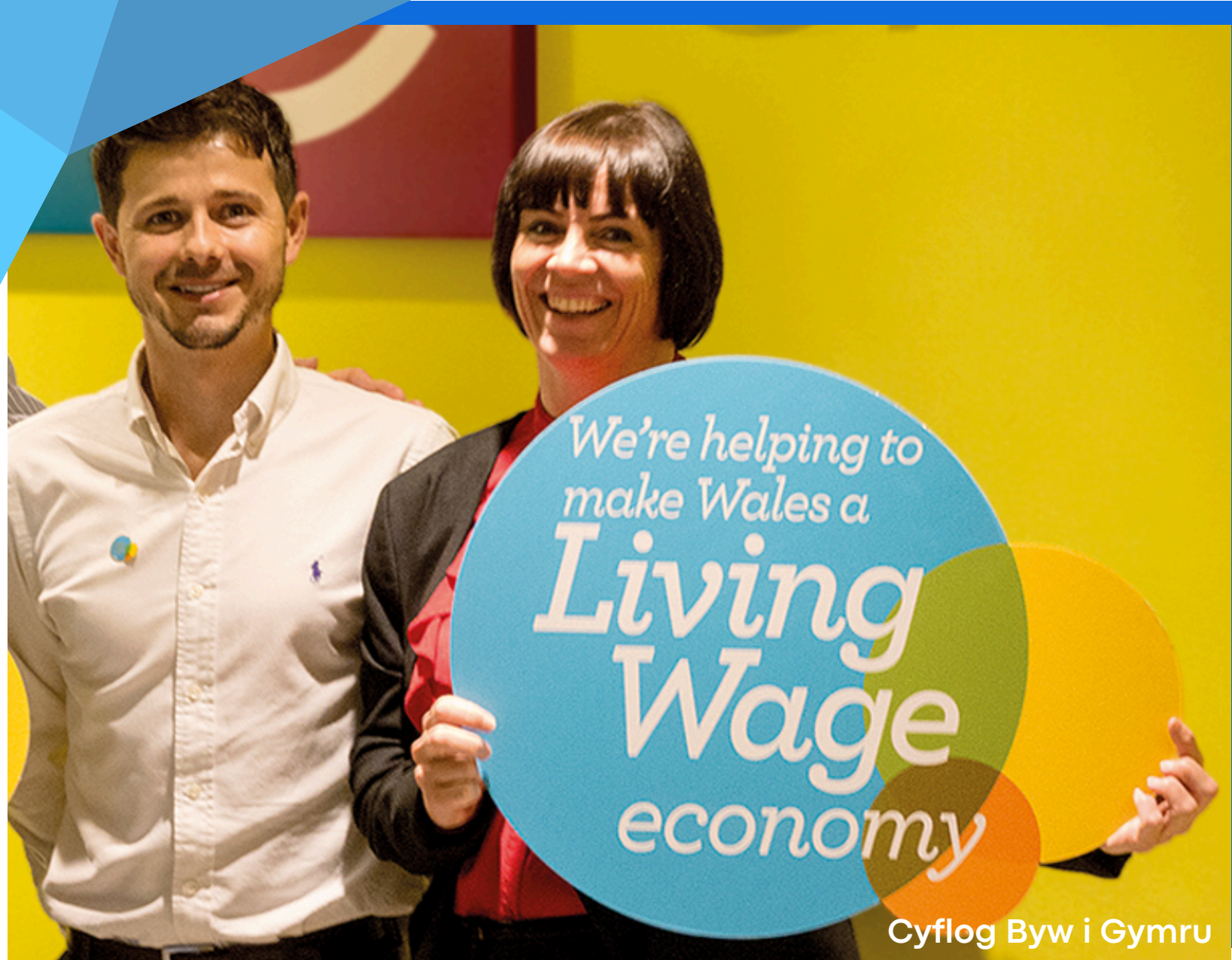
Cyflog Byw i Gymru

Mae gwaith teg yn elfen graidd o'r Contract Economaidd a'r Addewid Twf Gwyrdd, felly drwy wreiddio arferion gwaith teg, byddwch yn alinio eich busnes â'r mentrau allweddol hyn yng Nghymru ac yn dangos eich ymrwymiad i arferion busnes cynaliadwy a theg.