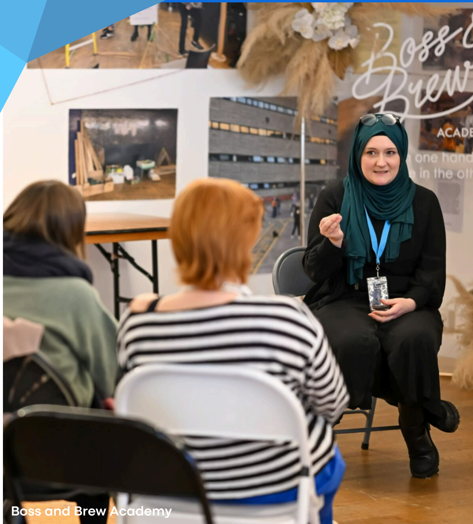
Boss and Brew Academy