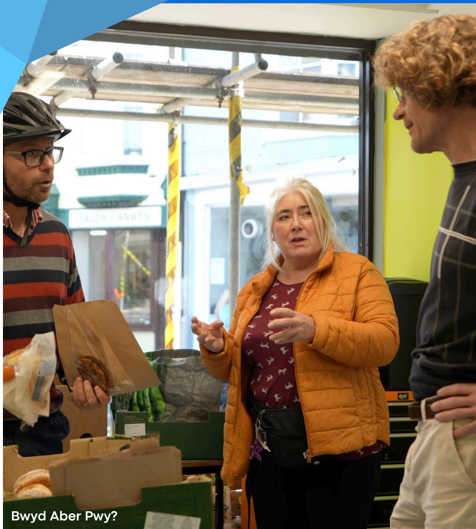
Bwyd Aber Pwy?

Drwy gymryd camau yn y maes hwn, byddwch yn cyfrannu at nod Cymru o Gymunedau Cydlynus drwy hyrwyddo llesiant a gofal amgylcheddol yn eich cymuned. Mae hyn nid yn unig yn cryfhau eich busnes ond hefyd yn meithrin cyd-gefnogaeth ac ymddiriedaeth yn y cymunedau yr ydych yn eu gwasanaethu.