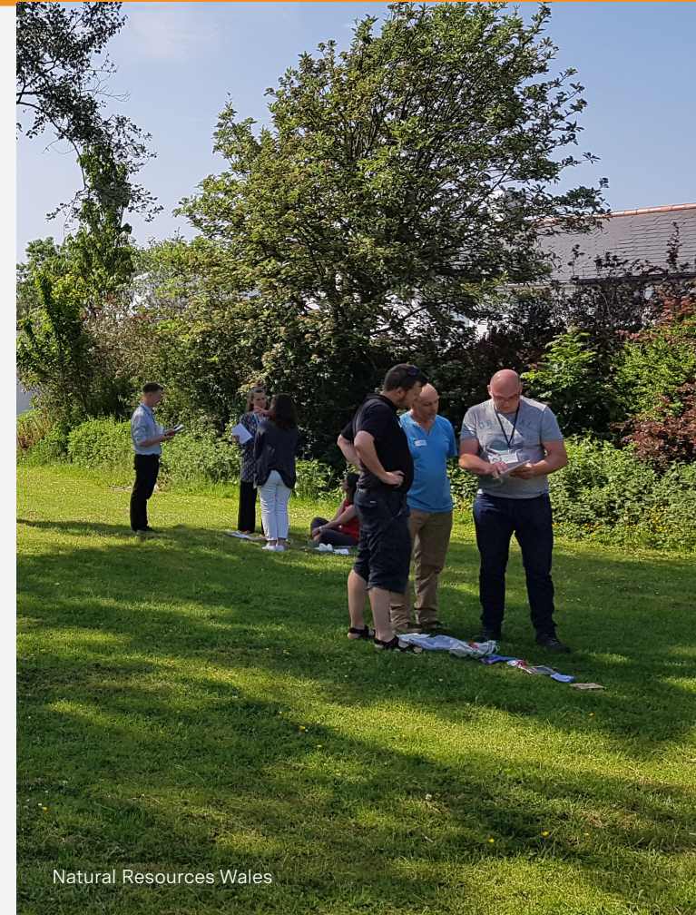
Natural Resources Wales

Trwy'r ddogfen hon fe welch nifer o adroddiadau sy'n berthnasol i'r pwnc. Os rydych yn gweld y symbol hwn cliciwch ar y ddolen i ddarllen y stori.