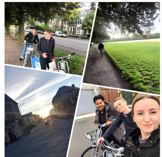
Roqib Monsur @MonsurMedia

Mae nextbike wedi bod yn hynod o lwyddiannus ers i'r beiciau cyntaf gael eu sefydlu'n gynharach eleni. Ar ddiwedd yr haf, ar ôl defnyddio'r beiciau'n gyson, daeth cyfle i fod yn llysgennad brand, ac fe wnes giipio'r cyfle gan fyd mod yn credu yn y cynllun ac yn awyddus i weld mwy o bobl yn eu defnyddio.