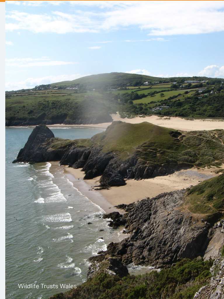
Wildlife Trusts Wales

Trwy'r ddogfen hon fe welwch nifer o adroddiadau sy'n berthnasol i'r pwnc. Os rydych yn gweld y symbol hwn cliciwch ar y ddolen i ddarllen y stori.